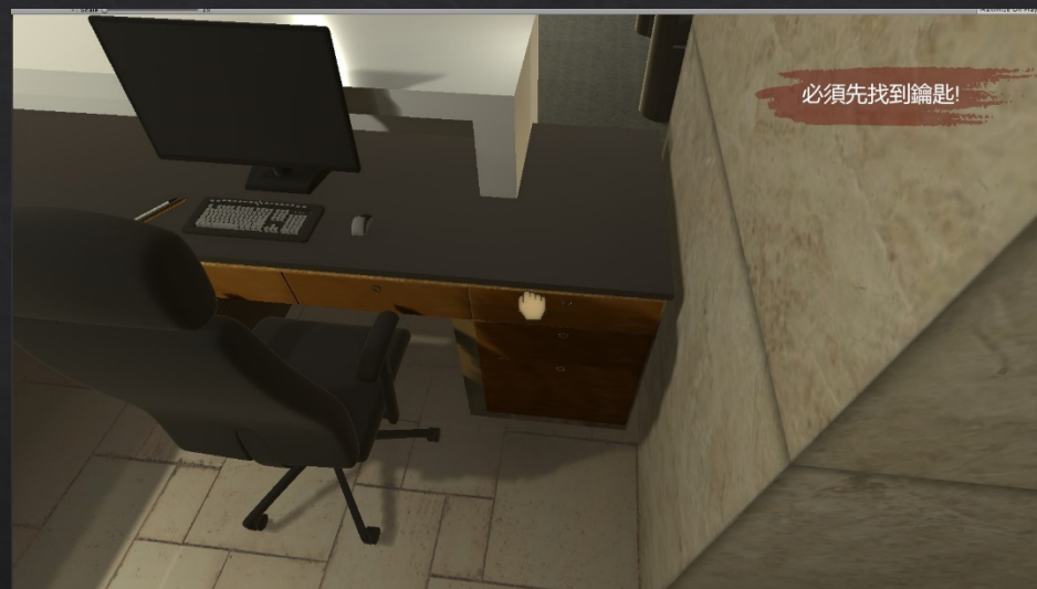
右上角為遊戲提示