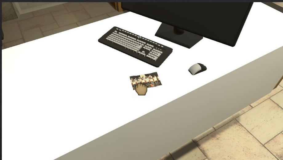
可觸發的物品，準心會呈現手的圖示